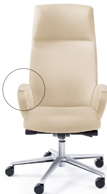
FORMAT 10SL CHROM O