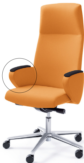
FORMAT 10SL CHROM O

Dostępne 2 rodzaje nakładek na podłokietniki: tapicerowane lub drewniane. 2 types of arm pads are available: upholstered or wooden.