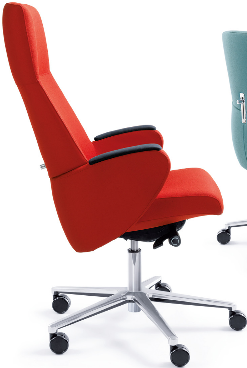
FORMAT 10SL CHROM O