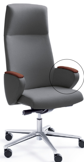
FORMAT 10SL CHROM H