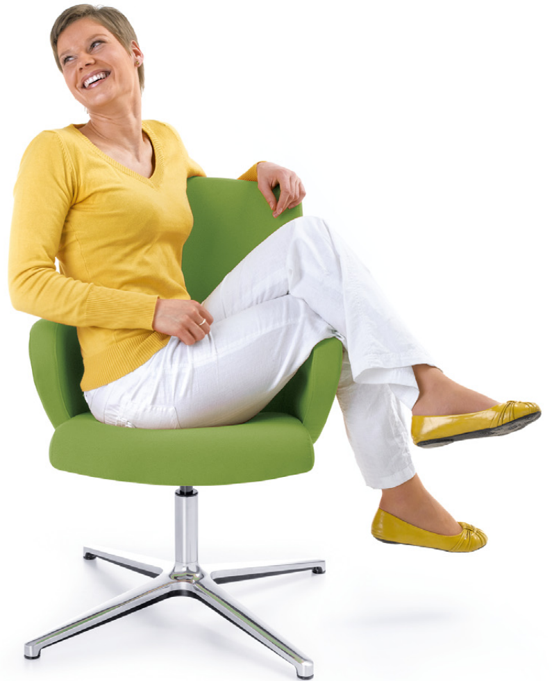
FORMAT 20F CHROM