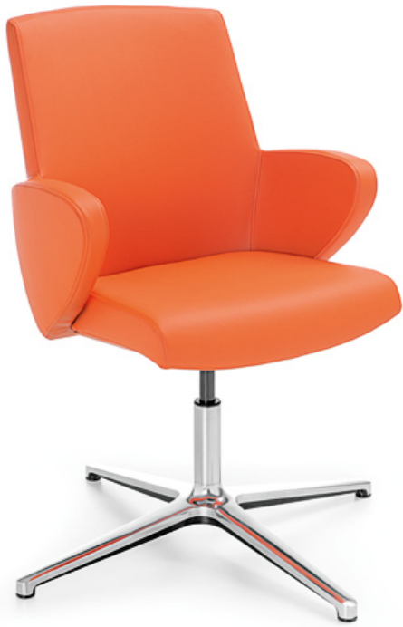
FORMAT 20F CHROM