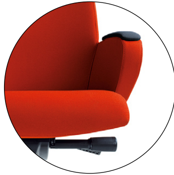
Mechanizm Synchro. Regulacja synchronicznego odchylenia oparcia i siedziska. Regulacja głębokości siedziska. Synchro mechanism. Seat depth adjustment.