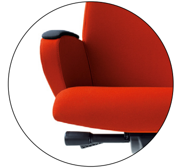
Regulacja wysokości siedziska. Regulacja siły sprężystości odchylenia oparcia i siedziska. Seat height adjustment. Tilt force adjustment.