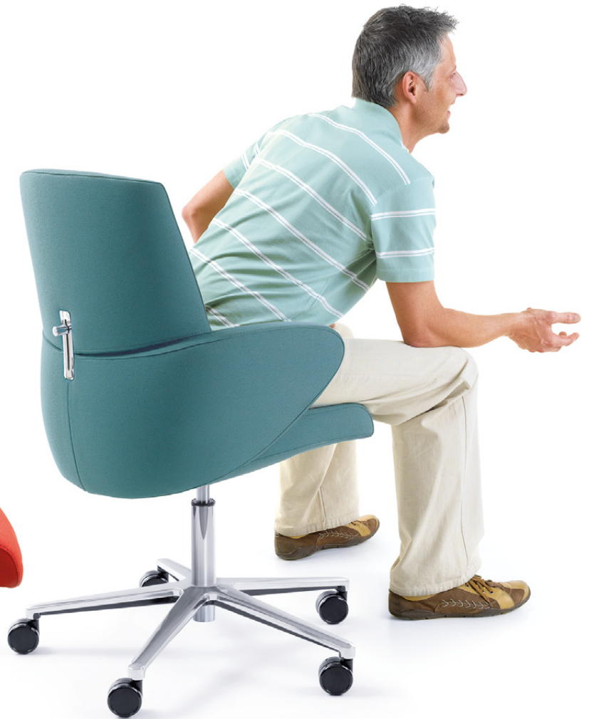
FORMAT 20E CHROM