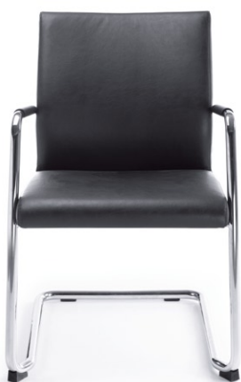
ACOS 20VN CHROM O