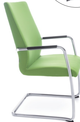
ACOS 10VN SATYNA O