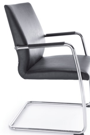
ACOS 20VN CHROM O