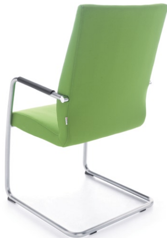
ACOS 10VN SATYNA O