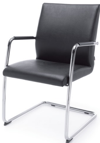
ACOS 20VN CHROM O