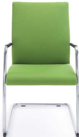
ACOS 10VN SATYNA O