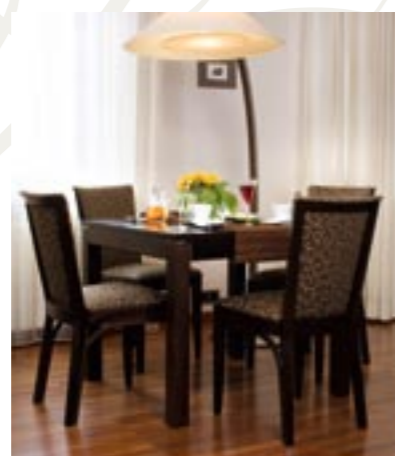
↑ Krzesła użyte w aranżacji: FLORENCE 1C: 4.047 czerwień klasyczna tapicerka: IN-01