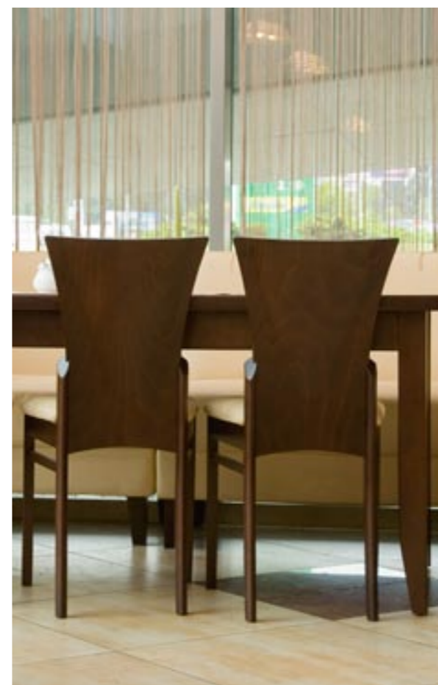
↑ Krzesła użyte w aranżacji: CRACOW 1B: 1.126 wenge klasyczne tapicerka: IN-01