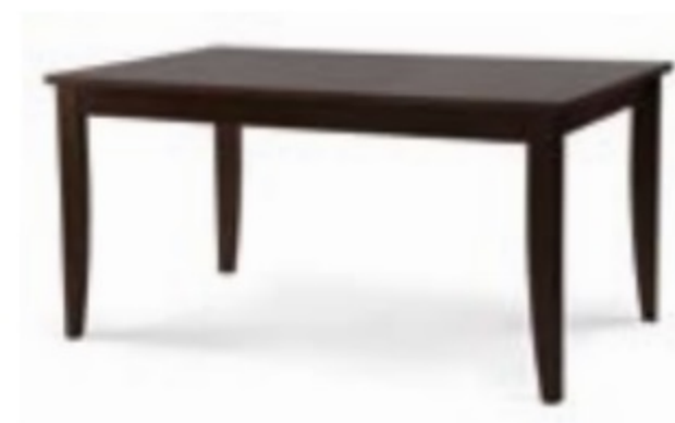
→ ALSACE NF Table MA (900 x 1500)