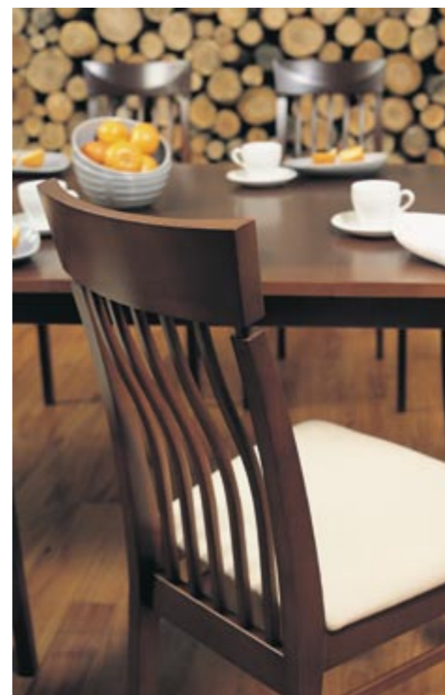
↑ Krzesła użyte w aranżacji: VIENNA 1B: 4.037 czereśnia antyczna tapicerka: IN-01