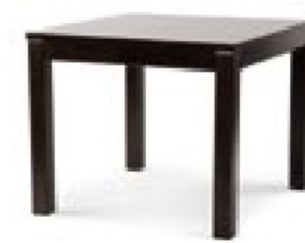
→ MODERN NF Table MA (900 x 900)