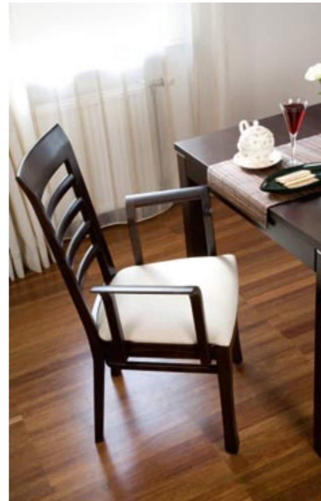
↑ Krzesła użyte w aranżacji: MADRID 2B: 1.126 wenge klasyczne tapicerka: NV-01