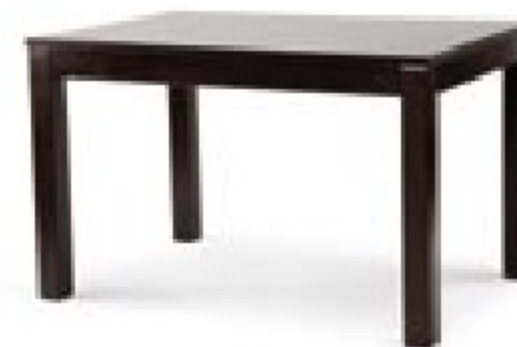
→ MODERN NF Table MA (800 x 1200)