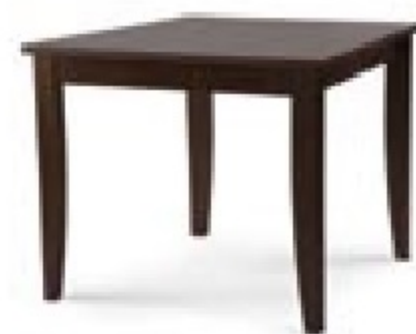
→ ALSACE NF Table MA (900 x 900)