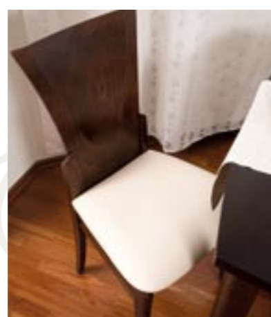
↑ Krzesła użyte w aranżacji: CRACOW 1B: 1.126 wenge klasyczne tapicerka: IN-01