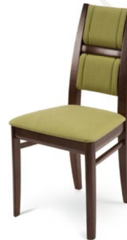
↑ Krzesła użyte w aranżacji: PARIS 1B: 4.037 czereśnia bursztyn tapicerka: SO-01