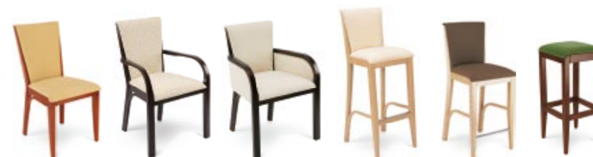
→ FLORENCE 1C