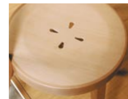
→ PALERMO 1B