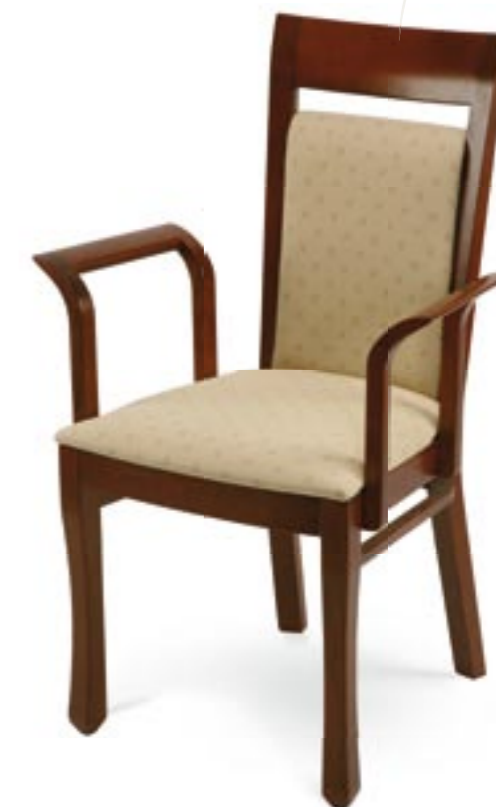
↑ Krzesła użyte w aranżacji: LISBON 1C: 1.126 wenge klasyczne tapicerka: TE-01