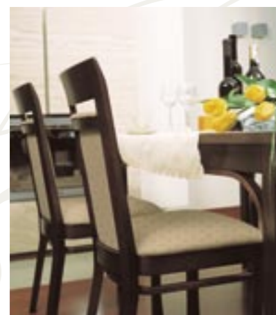
↑ Krzesła użyte w aranżacji: LISBON 1C: 1.126 wenge klasyczne tapicerka: SO-02