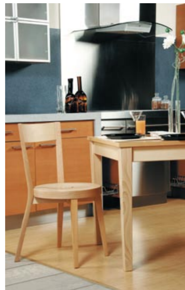
↑ Krzesła użyte w aranżacji: PALERMO 1A: 1.127 buk