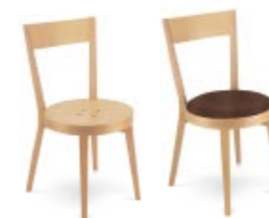
→ PALERMO 1A