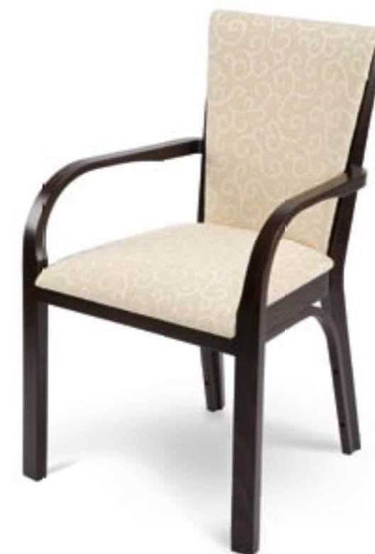
↑ Krzesła użyte w aranżacji: FLORENCE 6C: 1.126 wenge klasyczne tapicerka: TE-01