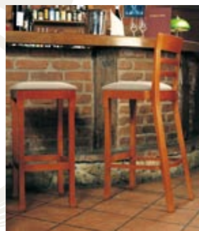
↑ Krzesła użyte w aranżacji: MADRID 1B, 2B: 4.037 czereśnia bursztyn tapicerka: NV-04