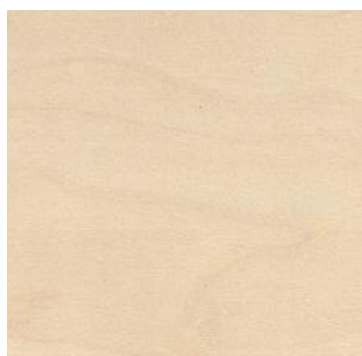
brzoza polarna D9420