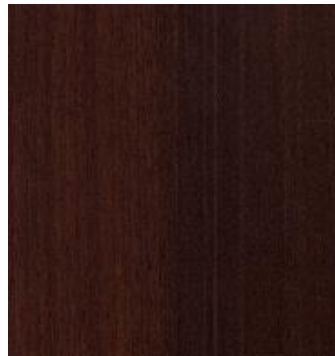
orzech ciemny D1925