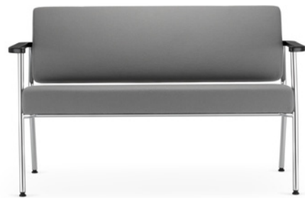
Zone sofa 2-osobowa Zone 2-seater sofa