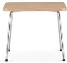
Zone stolik 55 x 55 Zone coffee table 55 x 55