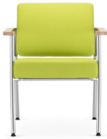
Zone fotel Zone armchair