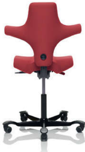
HÅG Capisco 8106 (baza czarna)