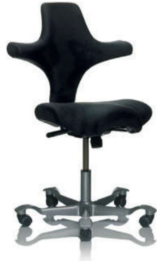
HÅG Capisco 8106 (baza srebrna)