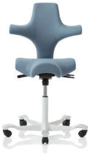
HÅG Capisco 8106 (baza biała)