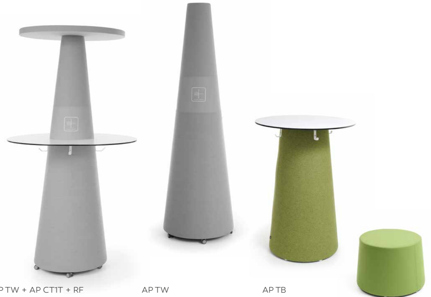
APTW + AP CT1T + RF

EN | Glass, concrete, metal – these materials dominate in every modern office building, at the same time disrupting the interior acoustics. One of the solutions for this problem are minimalist, innovative, and having unprecedented acoustic properties sound absorbers ACOUSTIC PEAK, that will effectively silence any interior.