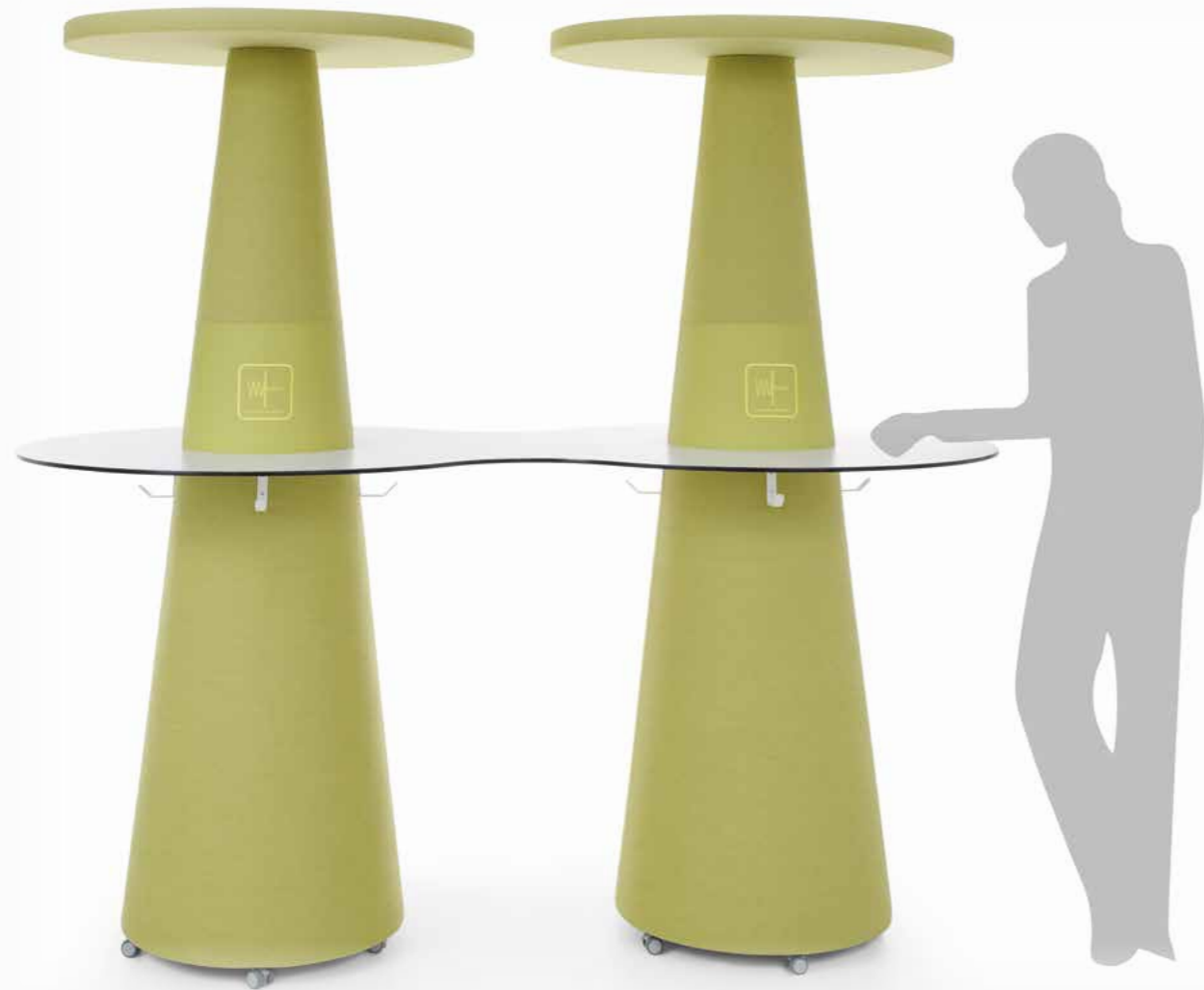
APTW + AP CT2T + 2xRF